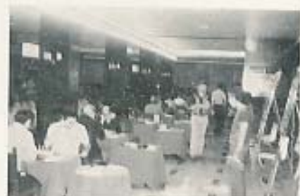
Vista panorámica de la Sala de Juego