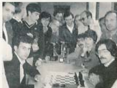
La gran final