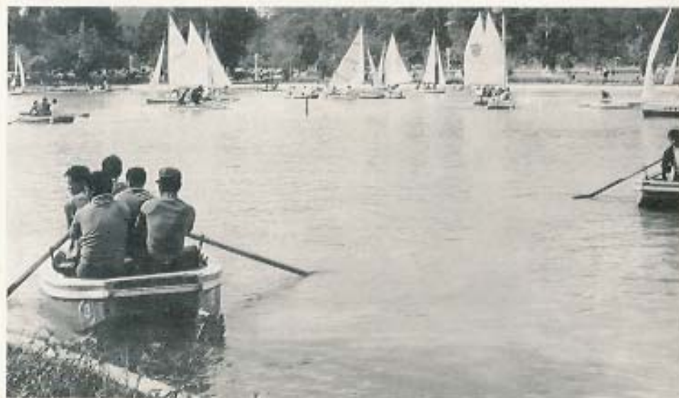
Parque de Baguio City diseñado por el arquitecto David Burham.

Baguio es una bella ciudad al Norte de Manila, a cuatro horas de coche o cuarenta y cinco minutos de avión. Su situación, en el interior, a cinco mil pies de altitud, no impide que se puedan practicar los deportes acuáticos en pleno centro de la ciudad gracias a su maravilloso parque central. Lugar turístico y coqueto, rodeado de montañas en su parte Norte que son visitadas mediante un tren especial. De clima tropical húmedo, destacan poderosamente las plantaciones de arroz y bananas situadas en terrazas que datan del año 2.000 antes de J.C. La particular idiosincrasia de sus gentes, así como el costumbrismo de sus habitantes, hace de Baguio un lugar digno de ser visitado.