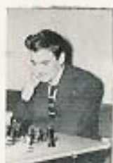
(Por José M.º González, desde Las Palmas)

Del 26 de abril al 20 de mayo, se celebró el VII Torneo Internacional Ciudad de Las Palmas, bajo la organización de aquella Federación de Ajedrez, con la participación de 16 jugadores de 11 naciones.