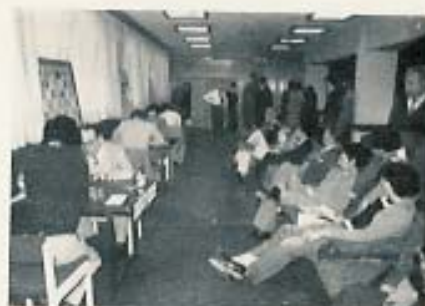
Panorámico de la Sala de Juego

El día 27 de marzo dio comienzo el Torneo, que ha venido desarrollándose hasta el día 5 de abril, con enorme éxito tanto de juego como de afluencia de público —que hacía insuficiente el local de juego— de todas las edades y condición, in-