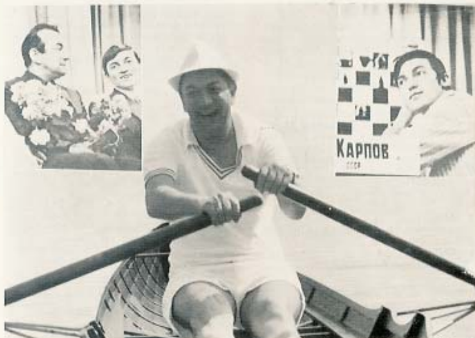
Pasado (match con Karpov en 1974), presente (La nave de la victoria llegó a Beer-Sheva), y futuro (Boquía-City y Karpov) de Viktor Korchnoi.

Sólo KORCHNOI sabe hacerlo; ¡ganarle con negras a un fuerte M.I. en 14 jugadas! Más todavía: enfrentado a una variante que, según la teoría, conduce casi forzosamente a las tablas. Veamos: