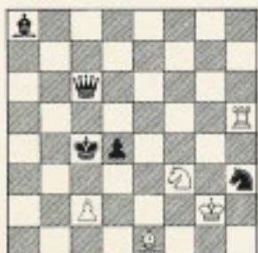
Nº 33 F. Sonnenfeld "SCHACH-ECHO" 1974