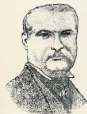
C. von Jaenisch 1813 - 1872

Las siete estrellas de Berlín, o más comúnmente conocidos como "La Pléyade" sólo estuvieron juntos dos años, pero fue más que suficiente para trazar ambiciosos planes que se fueron realizando al cabo de los años. Bledow quería que Alemania tuviera una revista que fuera como la "Palamede" para Francia o el "Chess Player's Chronicle" (fundada por H. Staunton en 1841) para Inglaterra. Bledow vivió lo suficiente para ver aparecer el primer número de "Schachzeitung", aparecido en Julio de 1846. Por su parte, Bilguer y von der Lasa se unieron para hacer el gigantesco Handbuch, que se convertiría en el libro modelo sobre aperturas.