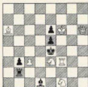
Nº 31 F. Sonnenfeld "IL DUE MOSSE" 1957

Por F. SONNENFELD JUEZ INTERNACIONAL DE LA FIDE