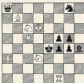
Nº 32 C. Mansfield "AJEDREZ ESPAÑOL" 1949