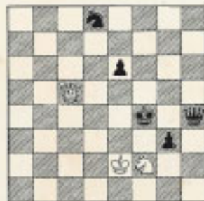
Nº 36 H. Lomer "NEW STATESMAN" 1967