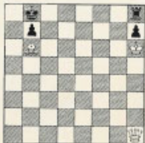
Nº 35 J. Vladimirov "DIE SCHWALBE" 1963