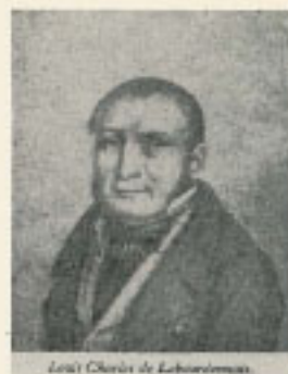
Louis Charles de Labourdonnais

(Continuación del artículo sobre LABOURDONNAIS)