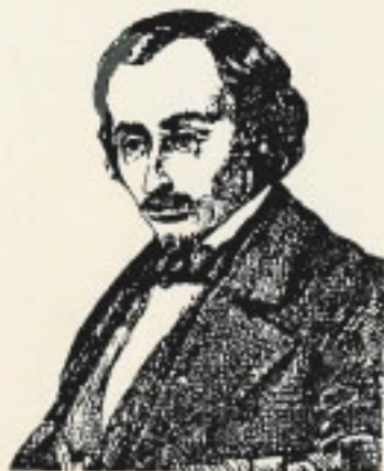
St. Amant, 1823 - 1864

De Labourdonnais se conservan, además de sus matches con Mc Donnell, otras 42 partidas contra diversos jugadores, de las cuales once fueron jugadas sin ver el tablero. Entre los adversarios que se enfrentaron a él recibiendo ventaja figuran: Popert, Perigal, Slous, Boncourt, George Walker y el polaco-francés L. Kieserivski.