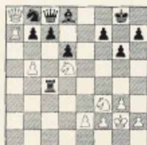
Ilustración drástica de las chances blancas en esta apertura tranquila.

19.Wa8 ♙e8 22.♙a7 ♙xc4 20.♙a1 e4 23.♗g2! Rinden 21.dxe4 ♙xe4 1-0